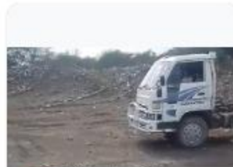
El ayuntamiento municipal y nuestro... 27 de mayo a las 5:14 a. m.