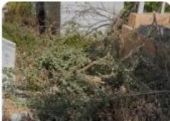
¿Qué se piensa hacer con esa situación? No es sol... 31 de mayo a las 10:18 p. m.