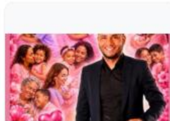
El alcalde Orangel Sena desea muchas felicidad... 31 de mayo a las 5:41 p. m.