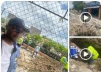
Hoy nuestro honorable alcalde Orangel Sena... 28 de mayo a las 9:55 p. m.