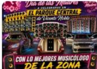
CON LO MEJORES MUSICÓLOGO DE LA ZONA El Ayuntamiento Municipal de Vicente... 28 de mayo a las 12:10 a. m.