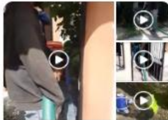
Sabemos que es una situación incómoda... 31 de mayo a las 6:50 p. m.